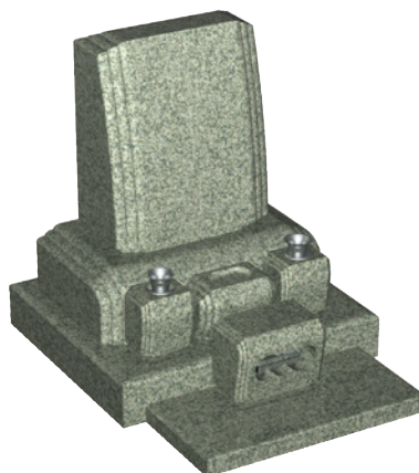
バルチックキング