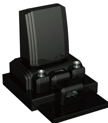
スウェーデンファイン